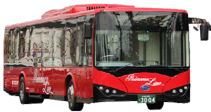
プリンセスライン バスのりば